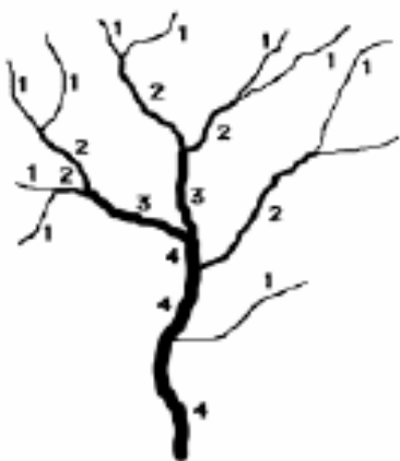
Figure 2 - Méthode d'ordination des cours d'eau selon Strahler (1957)

L'agrégation des données se fera par évaluation du pourcentage du linéaire impacté par cours d'eau puis par sous bassin versant et enfin par grande masse d'eau fonctionnelle (on caractérise trois types de masse d'eau pour lesquels l'agglomération des altérations sera fait graduellement : niveau 1 : le Léguer ; niveau 2 : les affluents principaux du Léguer dont le Guic et le Min Ran ; niveau 3 : les affluents secondaires) Ainsi il sera possible de caractériser le bon fonctionnement de chaque compartiment à l'échelle d'unité biologique fonctionnelle. Il sera aussi précisé les dégradations suivant l'ordre des cours d'eau (tête de bassin, cours principaux...)