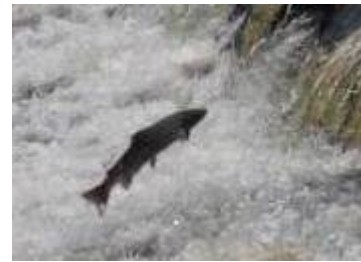
Mise en valeur et préservation de la Vallée du Léguer