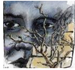
Photographies, théâtre de rue, aquarelles, contes... avec implication de la population locale