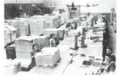
Réhabilitation des vestiges du barrage de Kernansquillec et des papeteries Vallée